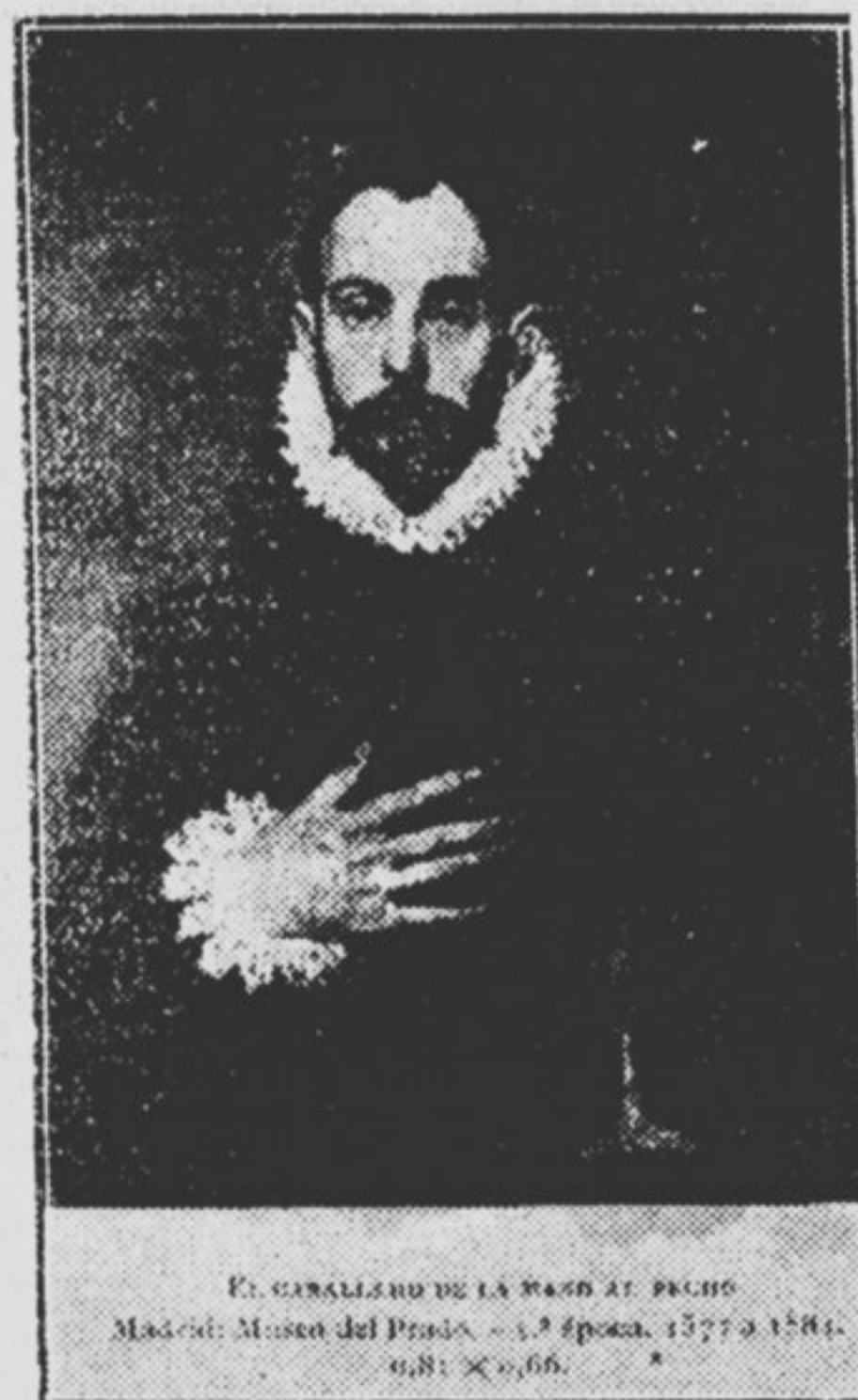
El Caballero de la mano en el pecho

El alargamiento de los cuerpos es sobre todo patente en el último periodo de su vida. Entonces busca el pintor ritmos de líneas ascendentes que exagera a propósito para acentuar la espiritualización marcada ya por el rostro y traducir los arranques de las almas y el dinamismo de los cuerpos hacia el cielo. Véanse, por ejemplo, en el museo del Prado: «El bautismo de Cristo», «La Resurrección», «La Pentecostés». Es este el procedimiento clásico para espiritualizar a un personaje. Lo usó Cervantes para idealizar a su caballero visionario, mientras materializó al escudero Sancho pintándolo pequeño, redondo y barrigudo.