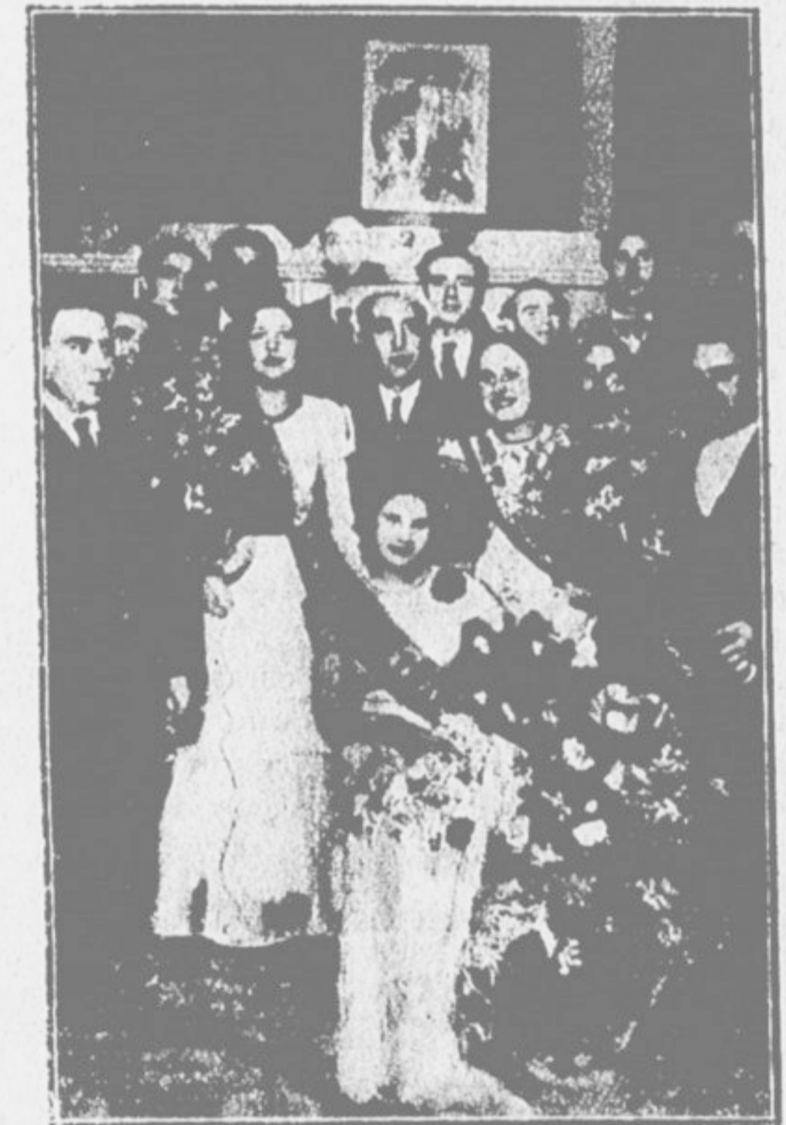
La Señorita Centro Español y las damas de honor