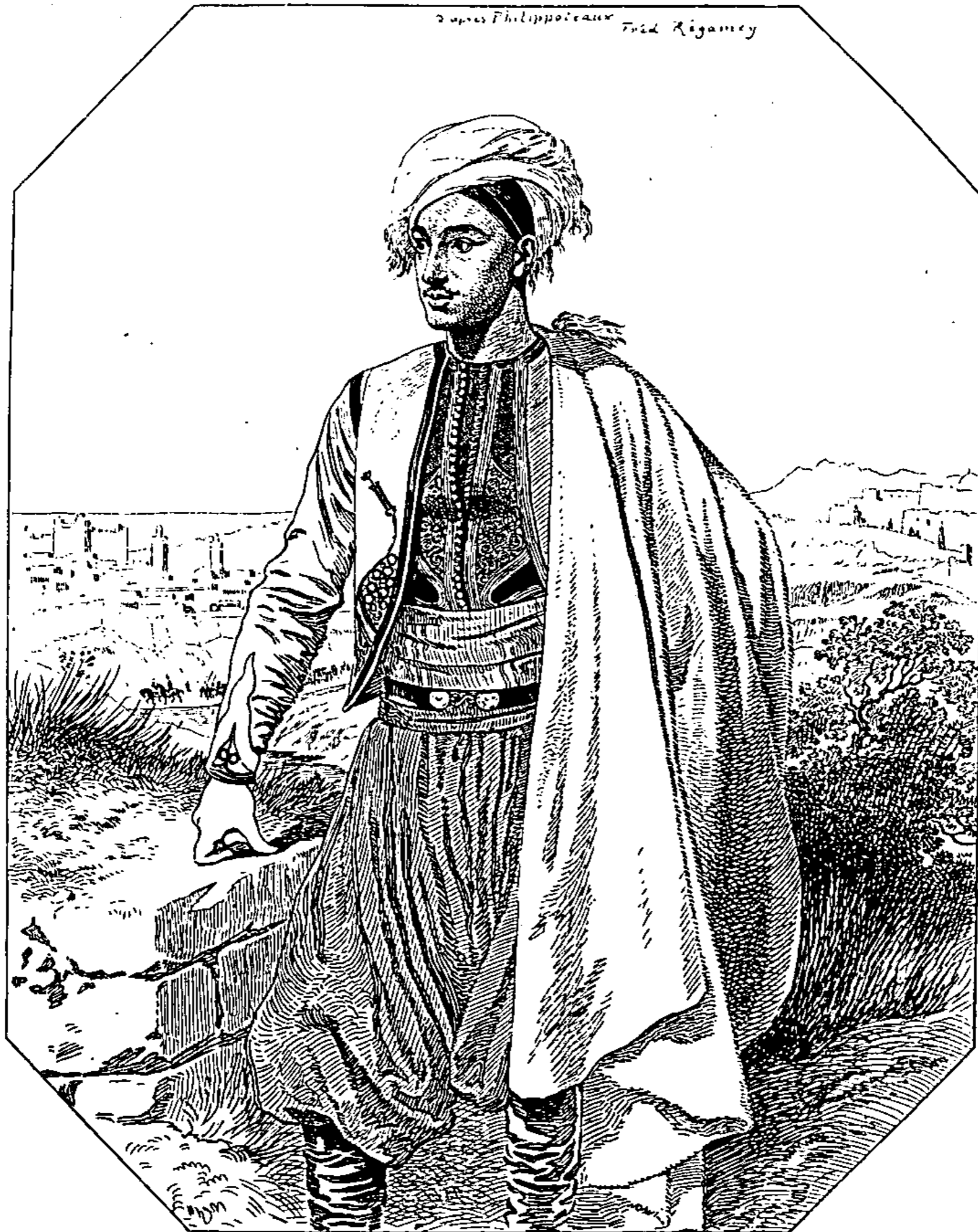
LE MARÉCHAL DES LOGIS DU BARAIL