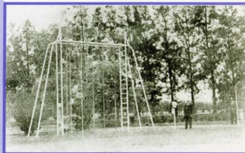
Le portique du stade " Robert MORIN "