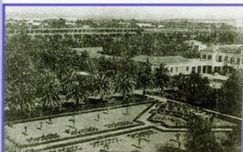
L' entrée de l' Agri avec sa roseraie