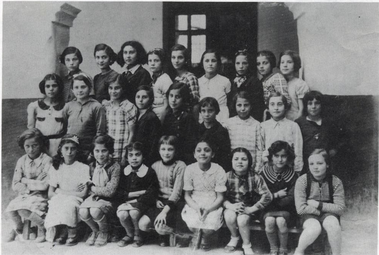
Ecole Eugène Etienne - Filles — année 1936-1937