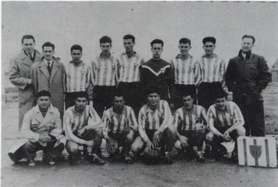
Equipe «Réserve» de l'ASBA (Association Sportive Bel-Abbésienne) Champion d'Oranie. 1955-56, 1 re Division. Dirigeants et Joueurs, vous reconnaissez-vous ?...