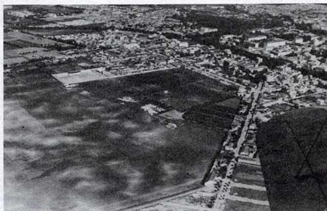
Photo aérienne prise vers 1961, à côté de l'aile de l'avion: l'avenue Jean Mermoz, les terrains, la vigne, la ferme et la cinique COLMAN, le stade "Paul ANDRE", la cave GOT "KINOURI", puis notre belle ville.