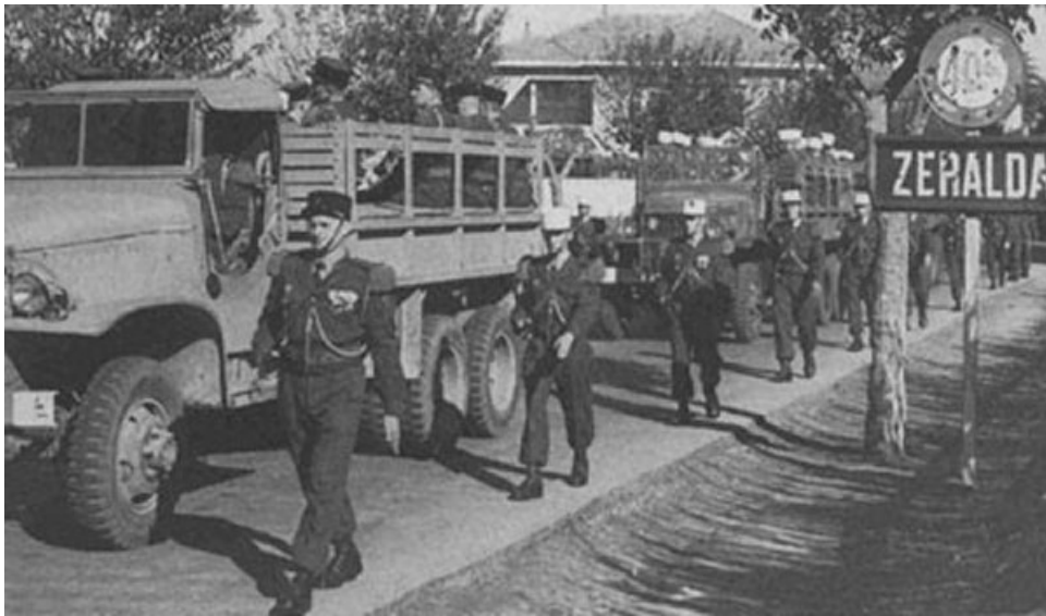
le 1er REP va quitter ZERALDA pour toujours..... (SCA)