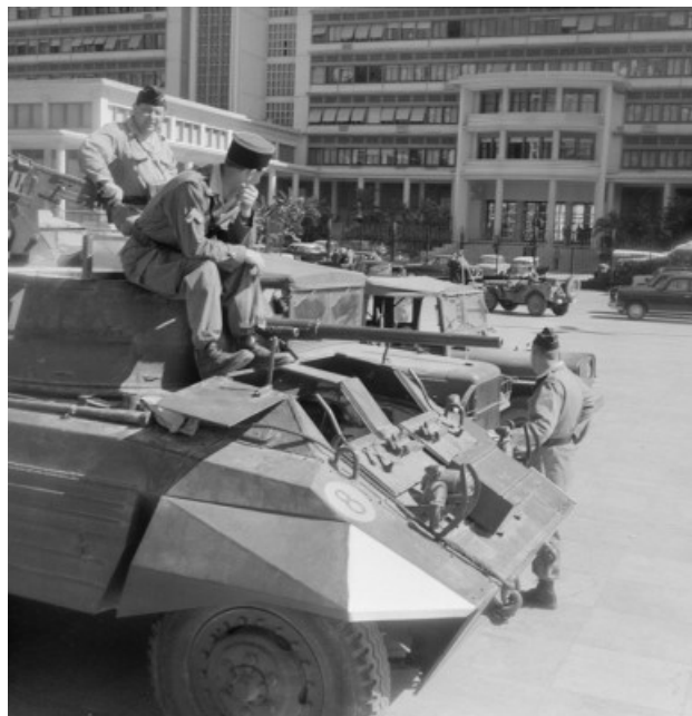
gendarmes mobiles sur le Forum (SCA)