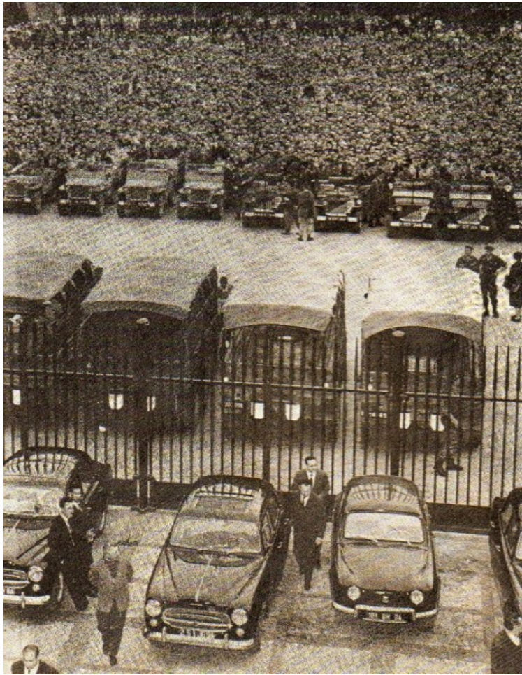
( doc. HISTORIA )