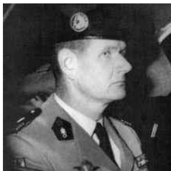
et au Commandant du 1er REP Hélié DENOIX DE SAINT MARC (SCA)