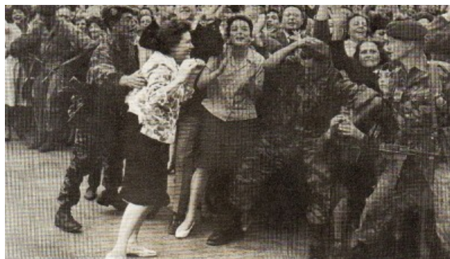
( doc. HISTORIA )