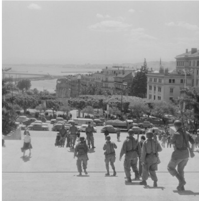
soldats «loyalistes» sur le Forum (SCA)