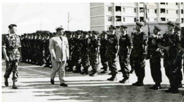
Le Général CHALLE passe en revue, les commandos de l'air en 1959

Mais au 21 avril, il ne dispose que de 2 compagnies dans l'Algérois, les commandos 20 et 40, en effet le Cdo 10 est en opération dans le sud de BERROUAGHIA, le 30 dans la région de BOUGIE et le 50 dans la zone de Colomb-Béchar.