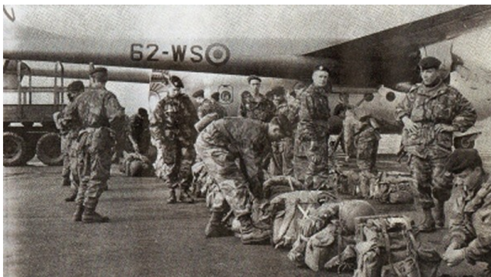
Les commandos de l'air, sont chargés d'occuper l'aéroport de la Maison-Blanche.....

La date retenue du soulèvement est fixée au 20 avril. Les chefs rebelles regagnent Alger en profitant des sympathies conservées dans l'armée de l'air. Ils se retrouvent à Alger le 20 au matin (sauf SALAN retardé) et installent leur P.C à la villa des Tagarins. Les unités sûres ne sont pas nombreuses, mais ce ne sont que des troupes d'élite : 1er REP, 1er, 14ème et 18ème RCP, le 27ème Dragons, le GCPA (commandos de l'air)....etc