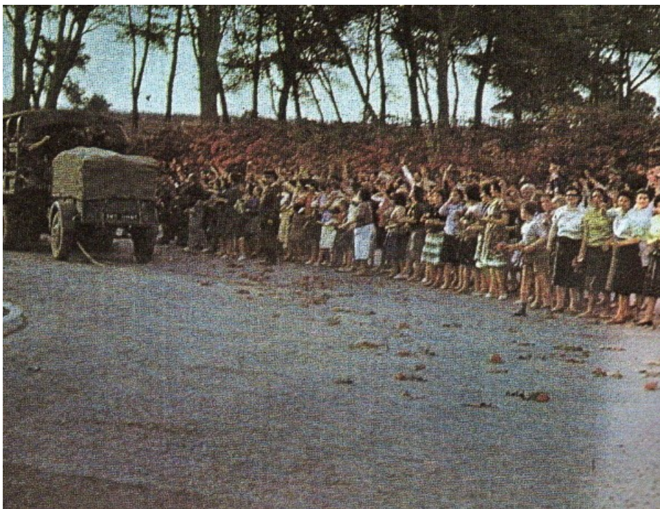
la population de ZERALDA dit ADIEU au 1er REP qui regagne SIDI-BEL-ABBES, où il va être dissous.....