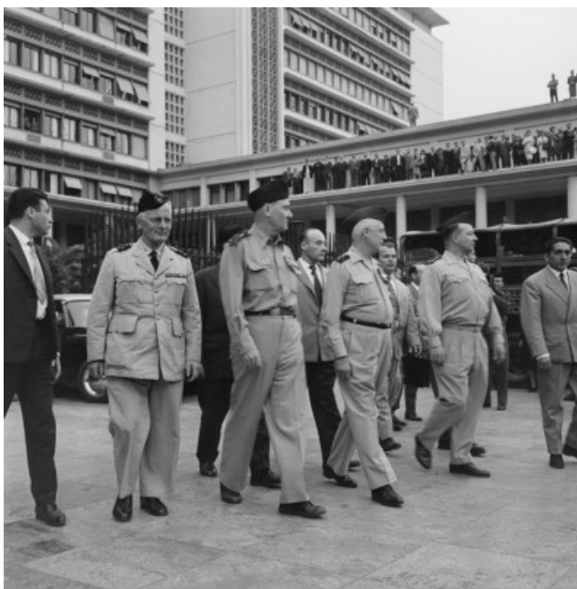
Les généraux ZELLER, JOUHAUD, SALAN et CHALLE.