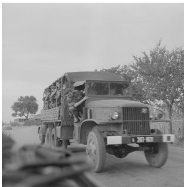
Le 1er REP en route pour SIDI-BEL-ABBES.....

« Non ! Rien de rien, je ne regrette rien, ni le bien qu'on m'a fait, ni le mal tout ça m'est bien égal !..... »