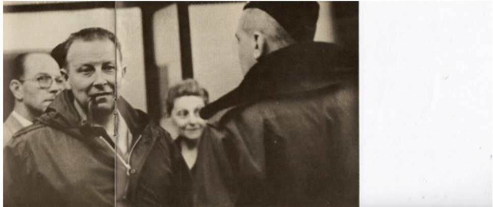
CHALLE épuisé, fait ses adieux à JOUHAUD

Alors que la métropole s'attend à un lancer de paras, annoncé par DEBRE, l'Algérie se retrouve coupée du monde. La journée du Lundi 24 avril se passe en ultimes atermoiements. Alors que CHALLE jette l'éponge, JOUHAUD, SALAN, SUSINI et d'autres, veulent continuer et lancent un appel aux européens. Les 4 Généraux se font acclamer une dernière fois sur le Forum, le Mardi 25 avril. Mercredi 26 avril, les unités légionnaires et parachutistes commencent à évacuer ALGER, ORAN et CONSTANTINE et rentrent dans leurs cantonnements.