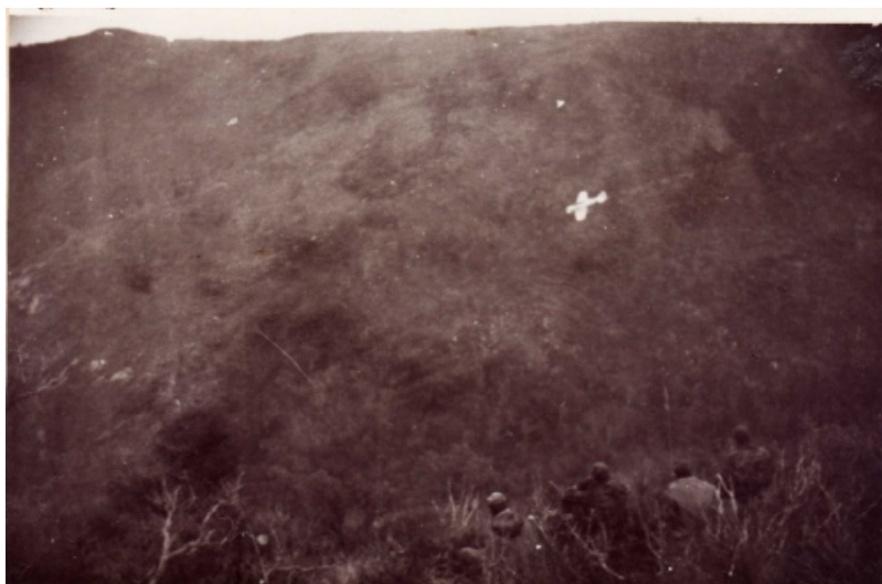
T6 en chouf