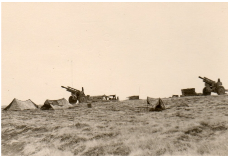
Protection du P.C de Challe

Et des repérages effectués par les commandos de chasse.