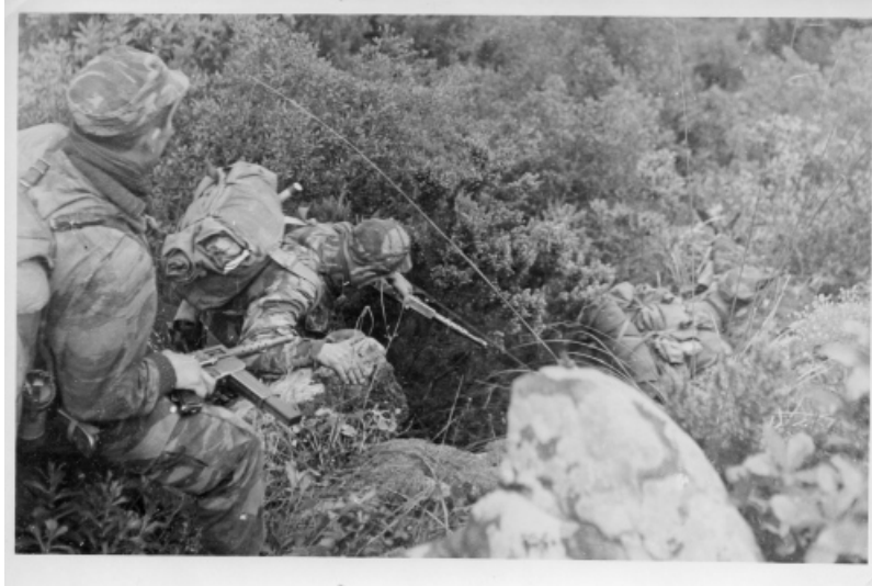
on fouille....