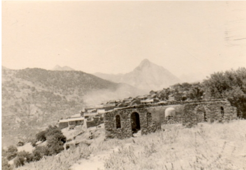
Village de Kabylie

se terraient. Les populations impressionnées par le rouleau compresseur de Challe, refusaient de ravitailler les djounouds.