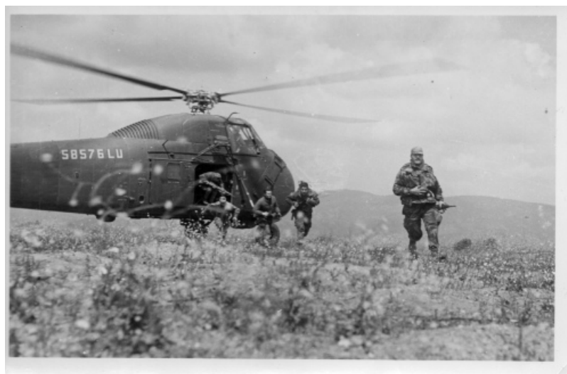
Hélicoptage, région de Bouïra

C'est la dernière opération pour le commando 10 en Kabylie.....Hélico H34 n°609, vol de 40', région de Bouïra.