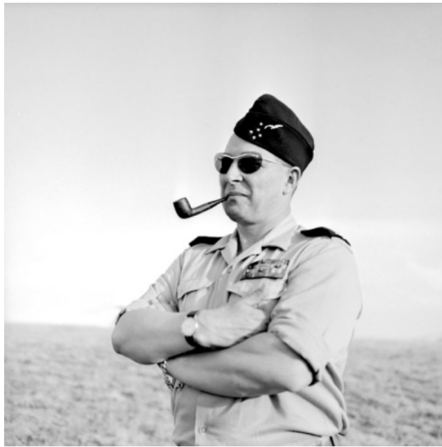
Général Maurice Challe, Cdt en Chef en Algérie