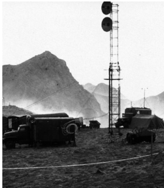
P.C «Artois» de «Jumelles».

Commencée le 21 juillet 1959, «Jumelles» se poursuit jusqu'en décembre, avec la quasi destruction de la willaya III. (unités engagées : 1er et 2ème REP, 5ème REI, 2ème RIMA, 12ème RCA, 1er RCP, 6ème RPIMA, en fait, l'effectif complet des 10ème et 25ème DP*)