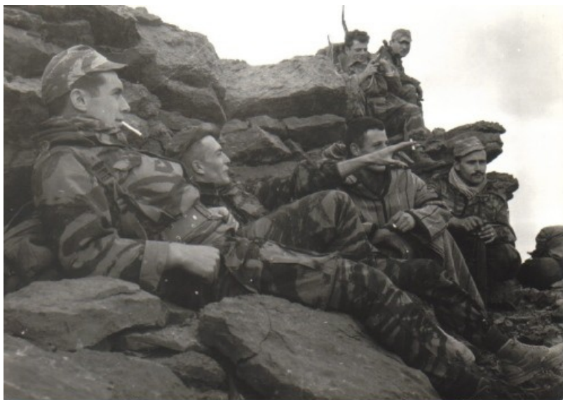
Poste de chouf

Maïs Goralzick est tombé dans une ravine et le temps de récupérer le fameux canon, les 2 fuyards se sont évanouis, au retour à la Reghaïa, j'écope de 8 jours de consigne. Pas cher payé pour une telle faute....le soir, retour camion.