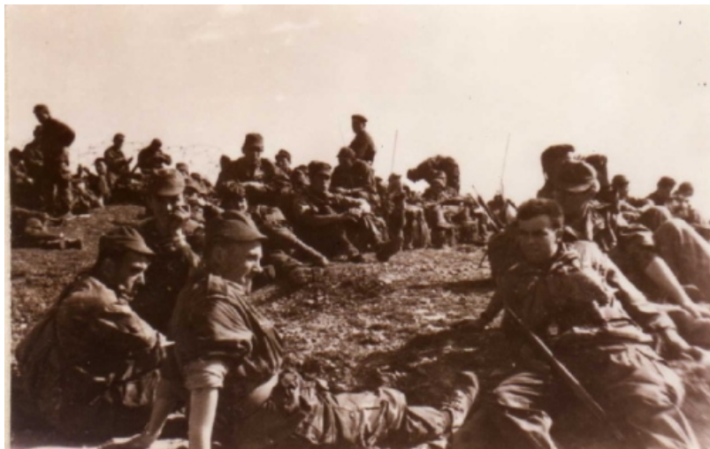
on attend, au 1er plan, un de mes pourvoyeurs, Latrille.