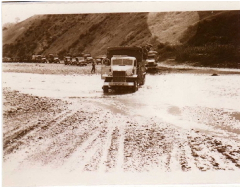
GMC du Train

Challe et Gracieux savaient que la Kabylie était un bloc de gruyère truffé de caches, de grottes, coupées de vallées profondes, de lits d'oued bordés de collines aux pentes escarpées, propices aux embuscades. Impossible de mettre des soldats partout et inutile de monter de grandes opérations de ratissage, qui ne donnaient que peu de résultats. Gracieux avait donc fait stationner des unités en des points névralgiques.