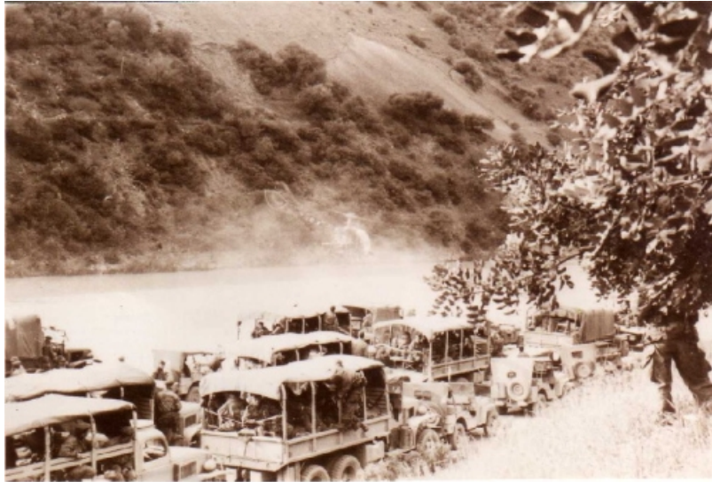
G.M.C du Train