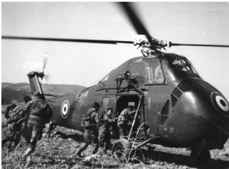
Alerte confirmée, embarquement immédiat.....