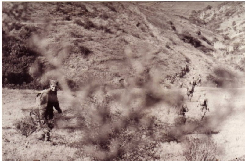
encore du ratissage.....

Les 5 premières semaines, les résultats obtenus étaient considérables, du jamais vu. Les fells étaient coupés des villages, l'organisation politico-militaire du FLN s'écroulait.