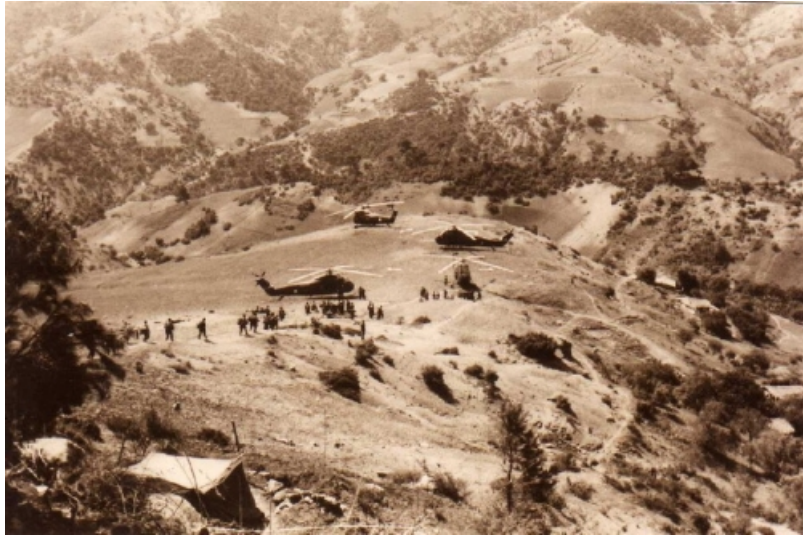
Cie en alerte quelque part en Kabylie