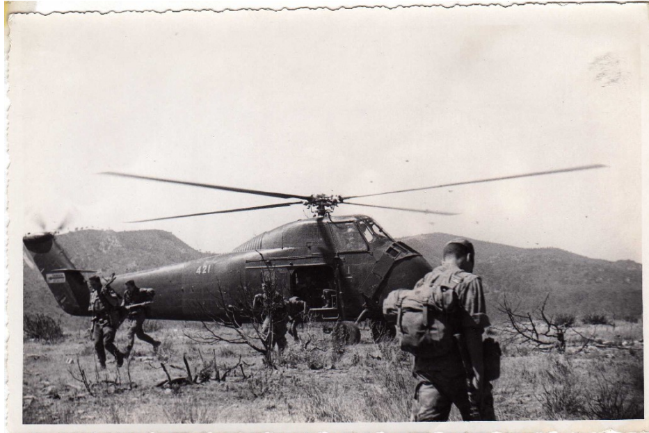
Sikorsky H34 de l'armée de l'air, basé à la Sénia

Pour les opérations dans le triangle Tiaret-Saïda-Aflou, nous sommes basés à La Sénia et utilisons plutôt des H34.