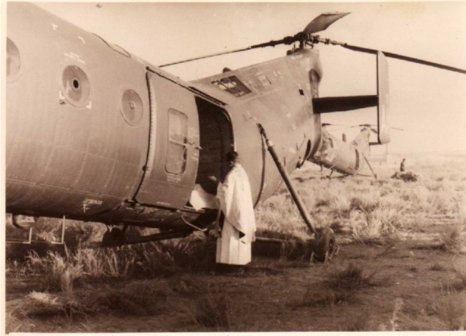
messe exceptionnelle sur les hauts plateaux