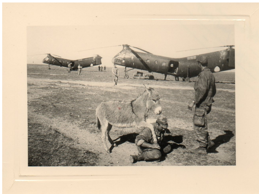
La Fontaine du Génie, pause avec un petit âne