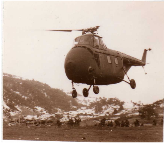
Sikorsky H19 en action