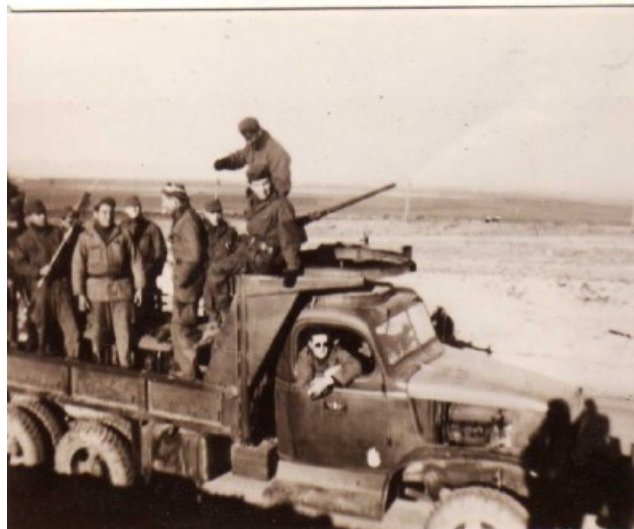
GMC patrouilleur, dans le secteur d'Aflou