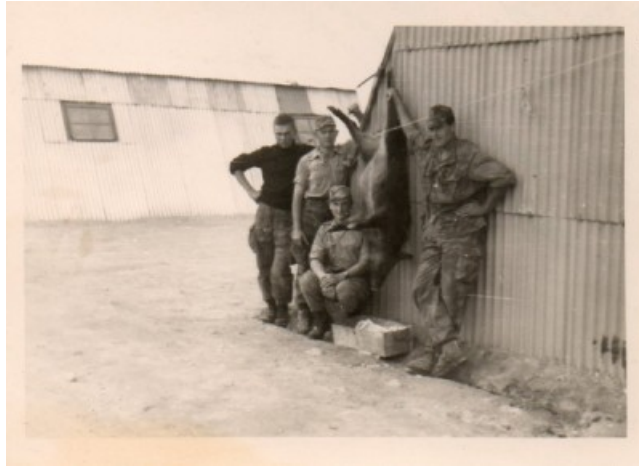
la base de Mecheria au retour de baroud (photo guy, en pull)