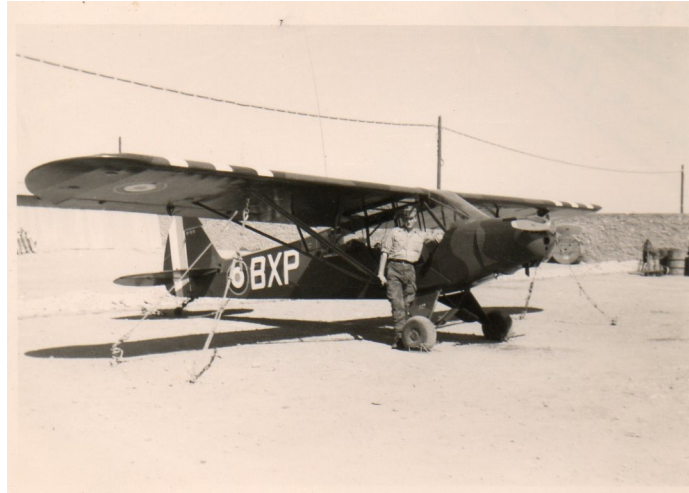
piper à la base de Mécheria

Car le soleil cogne dur ! Quand une bande rebelle est repérée par un piper d'observation,