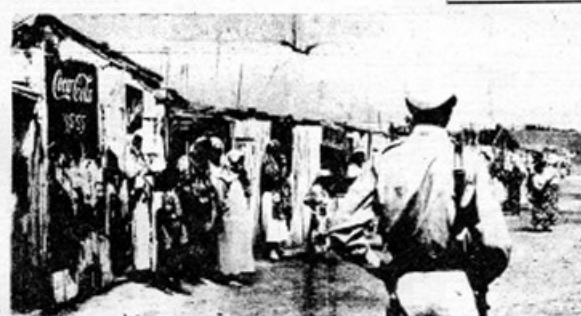
Une immense catastrophe

Le 20 août 1955, jour de la tournée du 20 août au Maroc, 50 Européens ont été assassinés.