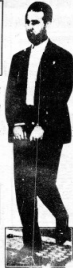
BEN BELLA - 1956 LE SON EN ROGATOIR

MERCREDI 24 OCTOBRE 1956 NOUVELLE SERIE N° 1254 1 ANNEE