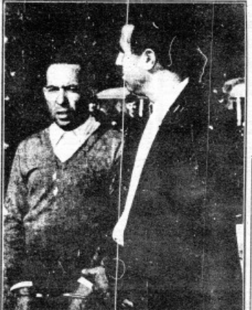
KHIDER (A GAUCHE) ET BEN BELLA

MOR. BEKKAI ET BALAFREJ A PARIS (LIRE NOS INFORMATIONS EN PAGE 2)