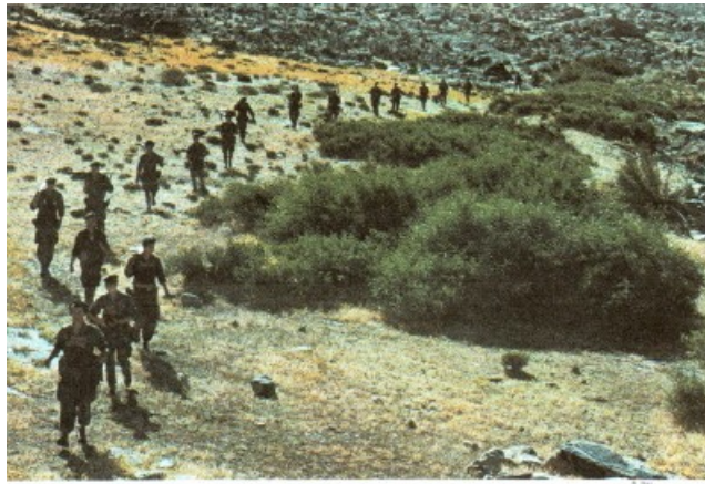
Paras du 18ème RIPC en crapahut

En mai, des attentats à Constantine et Mila « célèbrent » les événements de Sétif de mai 1945. Les unités paras du Colonel Ducourneau interviennent.