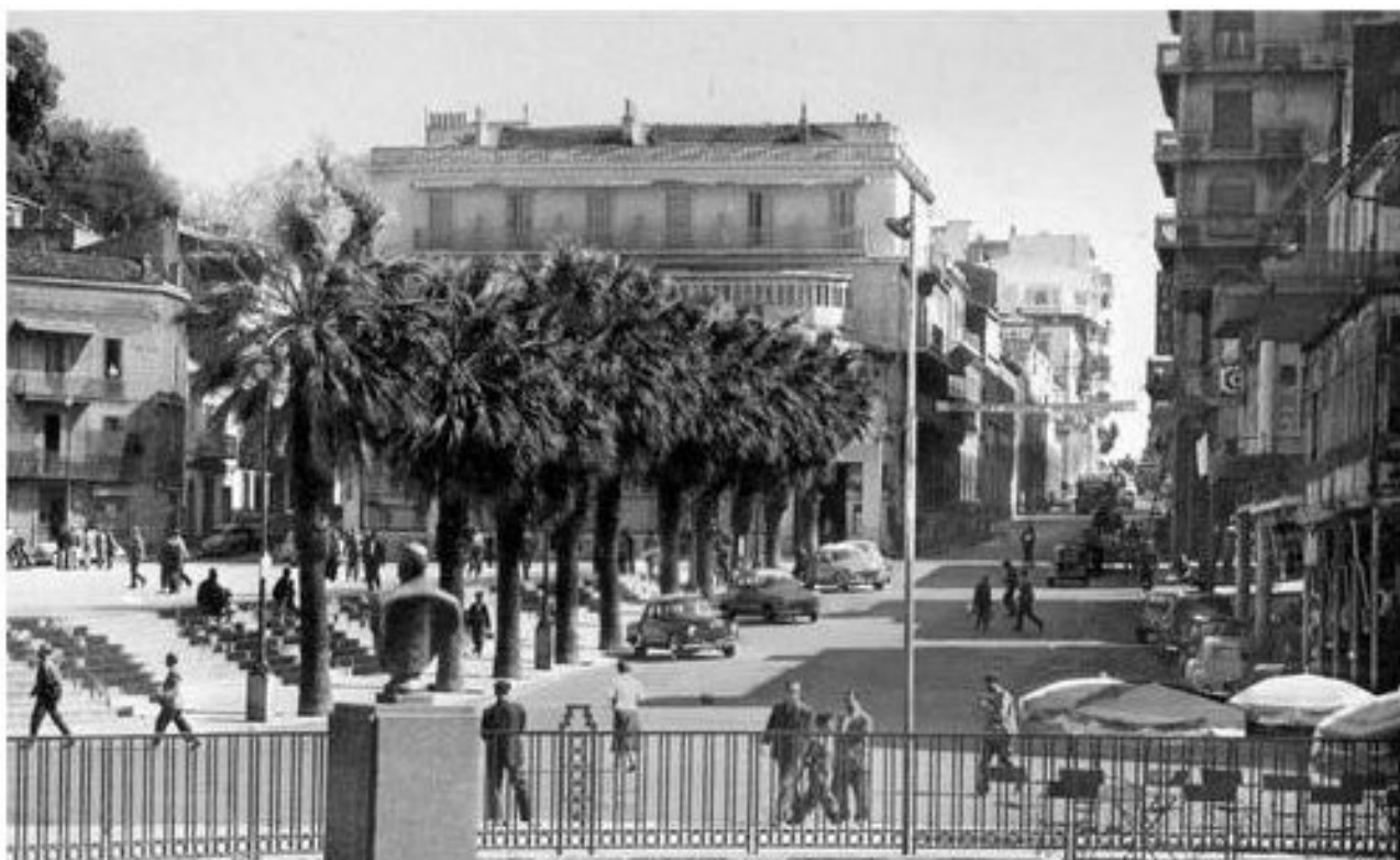
Philippeville, centre -ville, années 50

A Constantine, 8 bombes sont lancées presque simultanément. La 1ère éclate à 11h45 dans un café-restaurant, tuant ou blessant 14 personnes, 2 personnalités arabo-berbères sont assassinées, le neveu de Ferhat Abbas est abattu dans sa pharmacie, Belhadj Saïd délégué à l'assemblée algérienne est grièvement blessé de 4 balles.