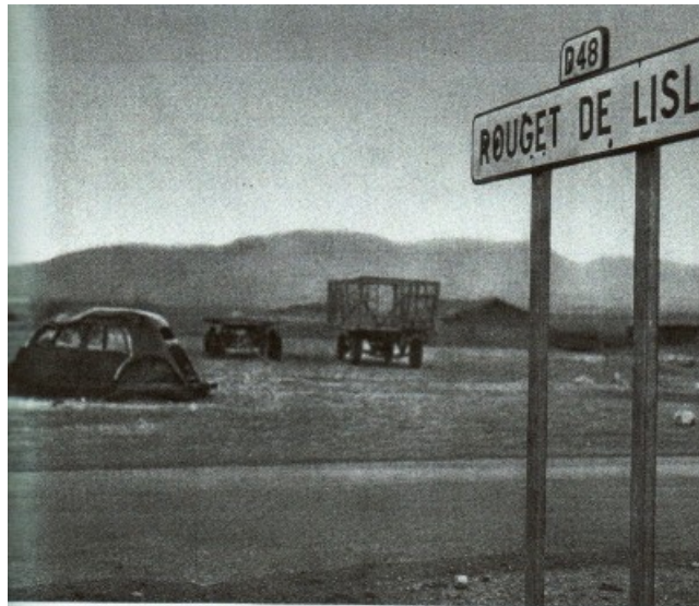
après un attentat entre Batna et Constantine