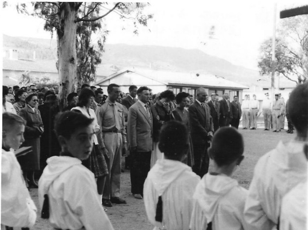
Obsèques d'un militaire à TENES

en complément : en mai 59, le CPA 10 était en opération au sud d'Affreville (voir la grande carte dans mon post, à Teniet El Haad), 2 sections auraient été détachées en renfort du CPA 20 au sud de TENES, c'est là que les commandos de l'air ont eu 4 ou 5 tués par un sniper en 1 heure, le camarade Etvignot y a laissé la vie.....on en saura peut-être plus avec le livre de B. L.