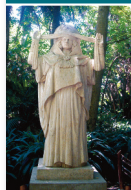
Inventaire d'un patrimoine - Dictionnaire des artistes